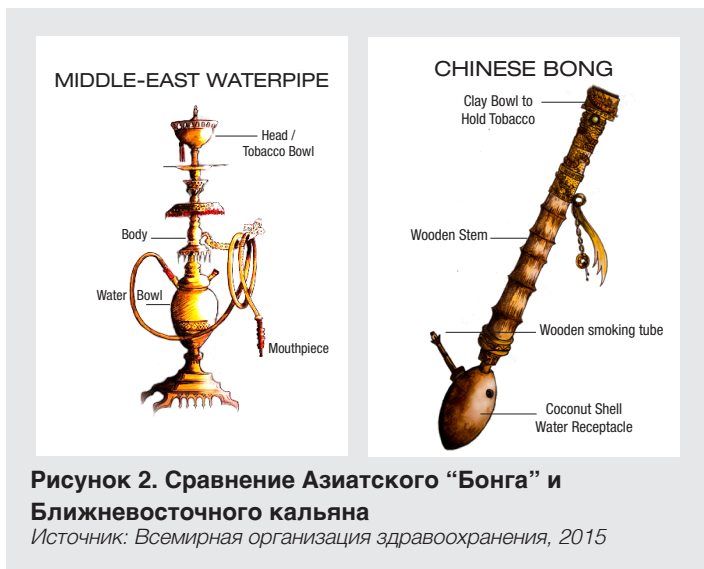
Рисунок 2. Сравнение Азиатского “Бонга” и Ближневосточного кальяна